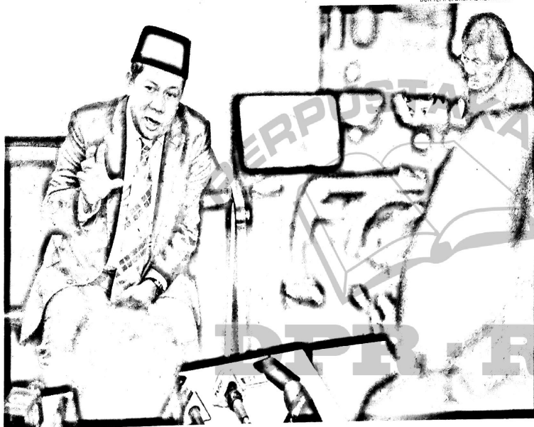
Wakil Ketua Dewan Perwakilan Rakyat, Fahri Hamzah, di Gedung Nusantara III, Kompleks Parlemen, Senayan, Jakarta, 2017. Fahri mengatakan sekretariat pimpinan telah menerima surat penetapan hasil seleksi dari pemimpin Komisi Keuangan.

Dewan Perwakilan Daerah akan melakukan uji kepatutan dan kelayakan calon.